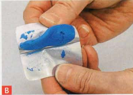
B Die Folienverpackung aufklappen, sugru entnehmen und gut durchkneten.