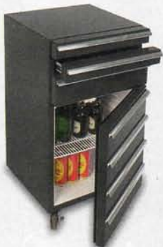
50 Liter Kühlvolumen, Effizienzklasse A+

HINGUCKER: Gastro-Cool- Kühlschrank im Werkstatt- wagen.