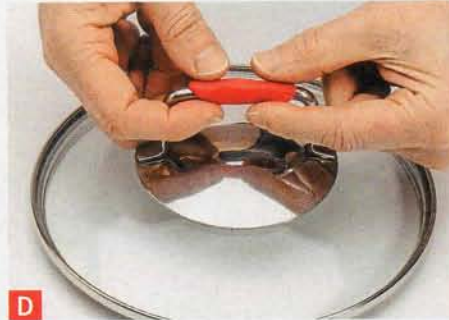
D Nach dem Aushärten bleibt sugru elastisch und wirkt wärmeisolierend, etwa bei Töpfen.