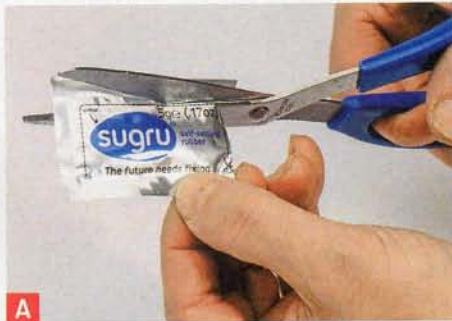
A Schneiden Sie das verschweißte Tütchen am Rand mit der Schere auf.

Per Post kamen acht einzeln verpackte 5-Gramm-Portionen sugru als multi-colour pack in die Redaktion. Der Preis beim Hersteller beträgt 15 Euro zzgl. Versandkosten in Höhe von 2,72 Euro. Das Material verbindet so viele Eigenschaften, dass es sich für unzählige Anwendungen eignet. Dies spiegelt sich auch in der großen Fangemeinde, die auf www.sugru.de immer neue Einsatzmöglichkeiten postet. Wir haben sugru erfolgreich als Topfgriff-Isolation, zur Reparatur eines Ladekabels und zum Ausbessern eines defekten Autoschlüssels verwendet und sind angetan von dem selbsthaftenden, einfach zu verarbeitenden Material, das sich mit Spülmittelwasser glätten lässt.